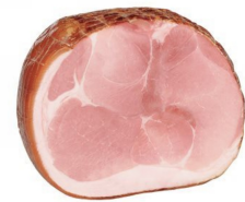
01150120 - COTTO TIPO PRAGA META'