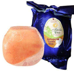
01150103 - PROSCIUTTO COTTO TAVOLA VIVA