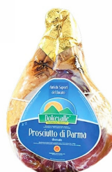
01150151 - PROSCIUTTO CRUDO PARMA S/O