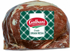
01150173 - CRUDO GRAN RESA