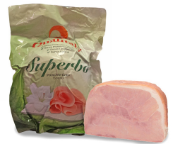
01150108 - PROSCIUTTO COTTO SUPERBO 1/2 MEZZO