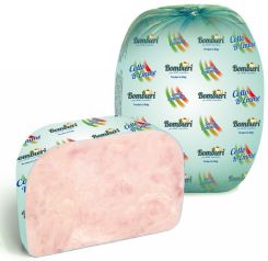
01150104 - PROSCIUTTO COTTO BIEMME