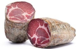
01150390 - COPPA INTERA TIPO PARMA