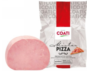
01150102 - COTTO MISTER PIZZA