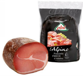
01150170 - PROSCIUTTO CRUDO FIOCCO META'