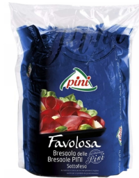
01150205 - BRESAOLA DELLA VALTELLINA 1/2 SV