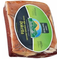
01150172 - CRUDO BAULETTO META'