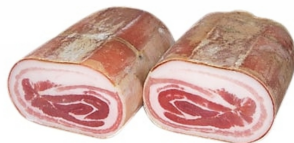
01150360 - PANCETTA S/C PIATTA RUSTICA META'