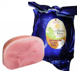
01150109 - PROSCIUTTO COTTO TAVOLA VIVA META'