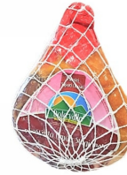
01150180 - PROSCIUTTO CRUDO MEC S/O