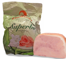
01150105 - PROSCIUTTO COTTO SUPERBO INTERO