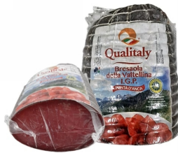
01150204 - BRESAOLA MANZO P.D'ANCA IGP 1/2