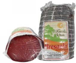
01150206 - BRESAOLA P.D'ANCA 1/2 TAVOLA VIVA