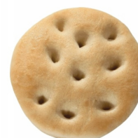
23040120 - FOCACCINA RUSTICA GR.100 4 PZ