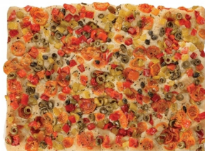
23040099 - FOCACCIA SICILIANA GR.850