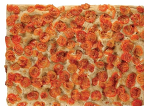
23040096 - FOCACCIA CON POMODORINI GR.850