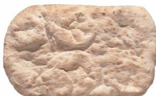
23040142 - PINSA ROMANA 18 X 38 CM. GR.300 12 PZ X CT