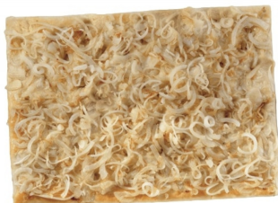
23040094 - FOCACCIA ALLA CIPOLLA GR.750