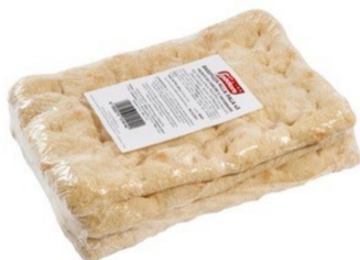
23040420 - BASE PIZZA ALLA PALA SURG. 29 X 19 - GR.210 - 3 PEZZI X CF.