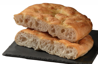
23040132 - STIRATELLA CON OLIO EXTRAVERGINE OLIVA GR.210 - 2 PZ X CF