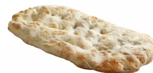
23040150 - MAXI PINSA ROMANA 24 X 40 CM. GR.375 8 PZ X CT