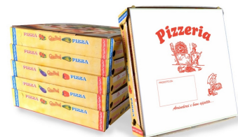
80500033 - VASSOIO/CUBO 32,5X32,5 200PZ