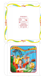
80500013 - SCATOLA X PIZZA 50X50X5 50PZ