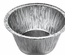
80550101 - VASCHETTA ALLUMINIO P.COTTA 100 PZ