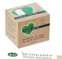
80600282 - PALETTINA 500 PZ IMBUST. LEGNO