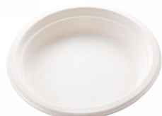
80600423 - PIATTO PIANO D.260 CE 50PZ