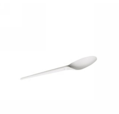
80600498 - CUCCHIAIO PLA 25PZ