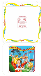
80500012 - SCATOLA X PIZZA 46X46 50PZ