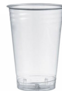
80600409 - BICCHIERE PLA 570CC TAC. 400CC 50PZ