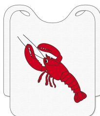
80500060 - BAVAGLIONI TNT PZ.100