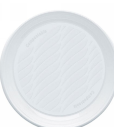
80600510 - PIATTO DESSERT BIOPLASTICA 50PZ