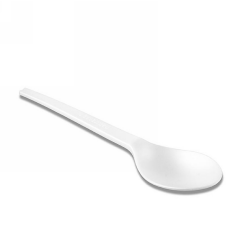
80600495 - CUCCHIAINO PLA 100 PZ