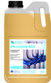
80600540 - UTILITY SPLENDOR BAR 6 KG