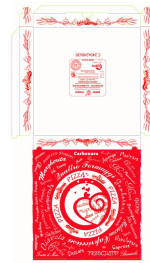
80500016 - SCATOLA X PIZZA 24X24 100PZ