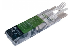
80600479 - BIS POSATE PLA+TOV.2V 200PZ