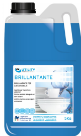
80600545 - UTILITY BRILLANTANTE 5 KG