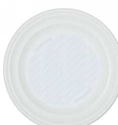
80600505 - PIATTO FONDO BIOPLASTICA 50PZ