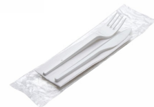
80600483 - BIS POSATE PLA+TOV.1V 500PZ