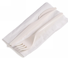
80600482 - BIS POSATE PLA+TOV.2V 500PZ