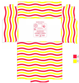
80500014 - SCATOLA X CALZONE