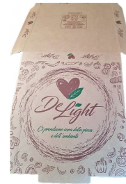
80500029 - SCATOLA X PIZZA AVANA DELIGHT 32,5X32,5 100PZ