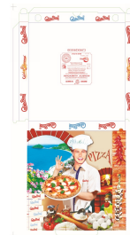
80500021 - SCATOLA X PIZZA 32,5X32,5 100PZ