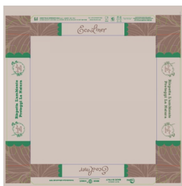
80500031 - VASSOIO/CUBO 32,5X32,5 AVANA 200PZ