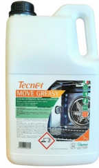
80600581 - TECNET MOVE GREASY/PIASTRE KG 5