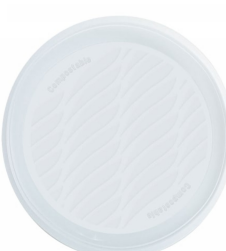
80600500 - PIATTO PIANO BIOPLASTICA 50PZ