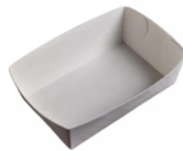
80600455 - VASCHETTA CARTONCINO COMP.CHIPS 250PZ