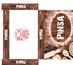
80500018 - SCATOLA X PINSA 38X23X5 100PZ