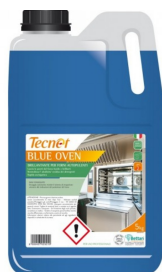
80600617 - T. BLUE OVEN BRILL. X FORNI AUTOP. 5KG