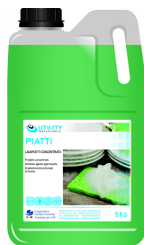
80600550 - UTILITY PIATTI 5 KG