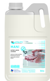
80600560 - UTILITY MANI 5 KG