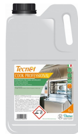
80600616 - COOK PROFESSIONAL X FORNI AUTOP. 6KG