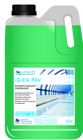
80600590 - UTILITY IGIEN PAV 5 KG