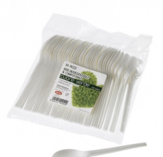
80600496 - CUCCHIAIO PLA 50PZ