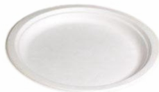
80600420 - PIATTO PIANO CE 50PZ