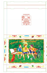
80500009 - SCATOLA X PIZZA 60X40X5 50PZ