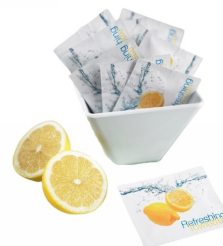
80500054 - SALVIETTA LIMONE PZ.500