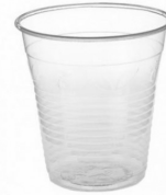
80600404 - BICCHIERE PLA 200CC 100PZ