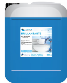
80600546 - UTILITY BRILLANTANTE 20 KG