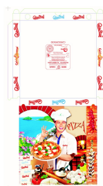
80500022 - SCATOLA X PIZZA 29,5X29,5 100PZ