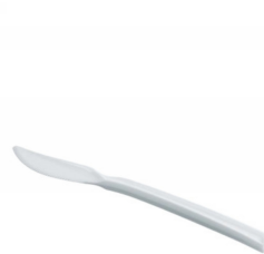
80600494 - COLTELLO PLA 50PZ