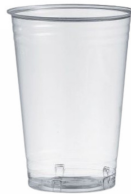
80600407 - BICCHIERE PLA 400CC TAC.300CC 50PZ