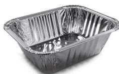
80550103 - VASCHETTA ALLUMINIO 1 PORZIONE 100 PZ