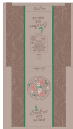
80500024 - SCATOLA X PIZZA 32,5X32,5 AVANA 100PZ