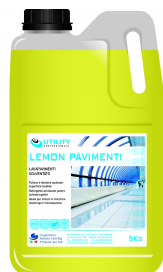
80600597 - UTILITY LEMON PAV 5 KG