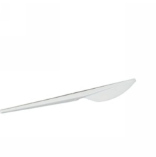
80600497 - COLTELLO PLA 25PZ