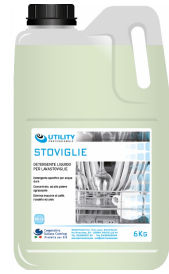
80600535 - UTILITY STOVIGLIE 6 KG