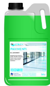
80600593 - UTILITY PAVIMENTI 5 KG