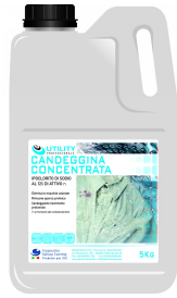
80600530 - UTILITY CANDEGGINA CONC.